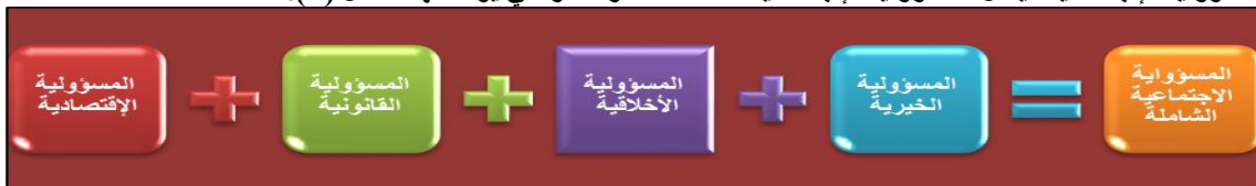
الشكل (٤) المسؤولية الاجتماعية الشاملة للشركات

العامري، صالح مهدي محسن، الغالبى، طاهر محسن منصور، المسؤولية الاجتماعية وأخلاقيات الأعمال: الأعمال والمجتمع، ٣، دار وائل للنشر، عمان: الأردن، (٢٠١٠). أن مجموع هذه المسؤوليات المتسلسلة والمتراطة للمسؤولية الاجتماعية، يمثل المسؤولية الاجتماعية الشاملة للشركة، والتي يوضحها الشكل (٤).