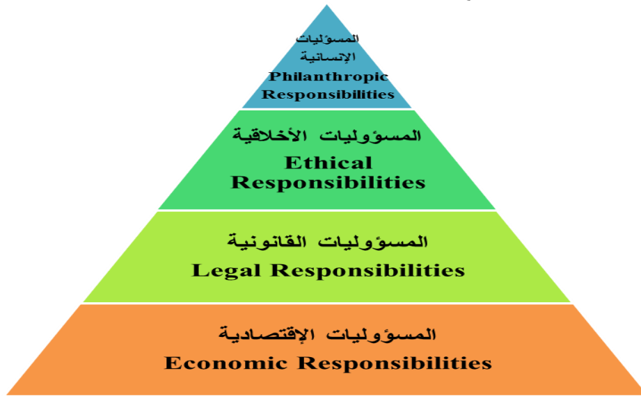
الشكل (٣) هرم المسؤولية الاجتماعية لمنظمة الأعمال

العامري، صالح مهدي محسن، الغالبى، طاهر محسن منصور، المسؤولية الاجتماعية وأخلاقيات الأعمال: الأعمال والمجتمع، ٣، دار وائل للنشر، عمان: الأردن، (٢٠١٠). أن مجموع هذه المسؤوليات المتسلسلة والمتراطة للمسؤولية الاجتماعية، يمثل المسؤولية الاجتماعية الشاملة للشركة، والتي يوضحها الشكل (٤).